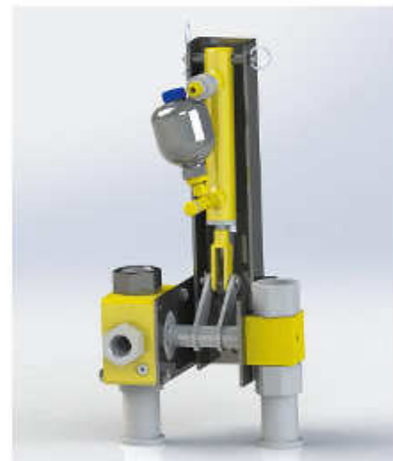
Aktueller Kombihydrant aus dem Jahre 2015 in der 5ten Generation